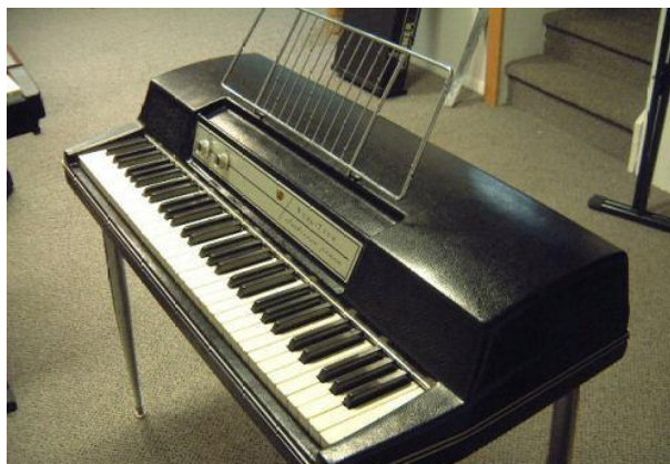
Obrázek 1 Elektrické piano [1]

Elektronické piano je elektronický klávesový nástroj napodobující zvuk klavíru. Od klasického klavíru se odlišuje tím, že zvuk je tvořen elektronicky a nikoliv kmitáním strun. Použité elektronické obvody jsou u moderních nástrojů digitální (digitální piana), starší elektronická piana generovala zvuk pomocí analogových obvodů. Tvarem elektronická piana nejčastěji vycházejí z pianina, modely určené pro pódiové použití bývají kompaktnější.