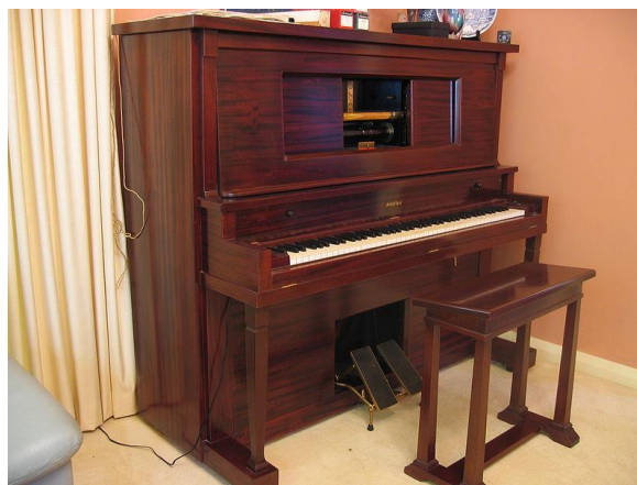
Obrázek 2 Pianola [3]

Začátkem minulého století se vyráběla také masivní pianina s tichým elektromotorem a pneumatickou mechanikou, do které se vkládal široký válec s děrovaným pruhem papíru, kde byl každý stisk klávesy naperforován. Takto upravené se nazývá pianola nebo mechanický automatický klavír. Sacím mechanismem se skladba snímala z pásu a přenášela na dřevěné měchy kláves, takže se klávesy samy stiskaly. [1]